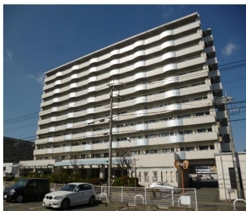
全戸140戸！11階建て！南向き！