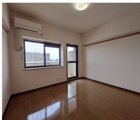
エアコン・照明器具付！28.01㎡！