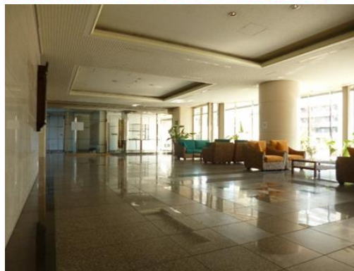
ソファ・テーブル設置のビター！ オートロック付！宅配ボックス新規設置！