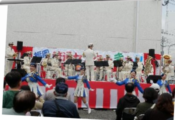
福岡市消防音楽隊