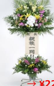
生花スタンド（お悔み） ¥27,500