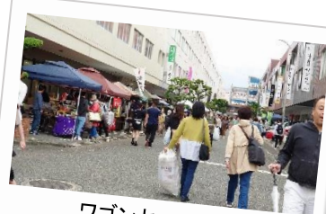
ワゴンセール会場