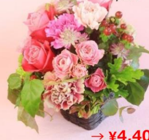
アレンジ花（イメージ） ¥5,500