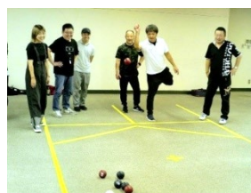
第1回ポッチャ大会の様子